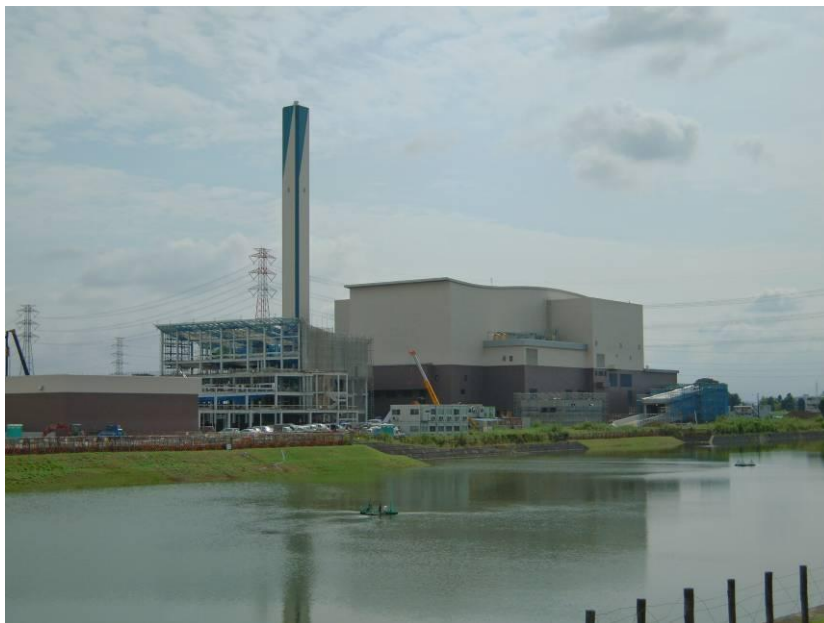
建設が進む、「川越市資源化センター」の全景

また、現在小畦川沿いには「新清掃センター」の工事が進められており、まもなく完成の予定です。